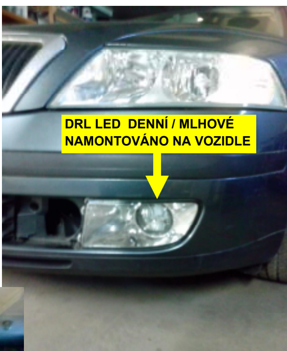
DRL LED DENNÍ / MLHOVÉ NAMONTOVÁNO NA VOZIDLE