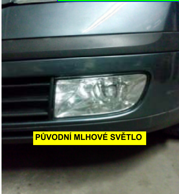
PŮVODNÍ MLHOVÉ SVĚTLO

MONTÁŽ OCTAVIA II DRL 90 DENNÍ / MLHOVÁ SVĚTLA