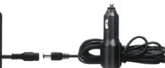
Napájecí kabel s koncovkou CL